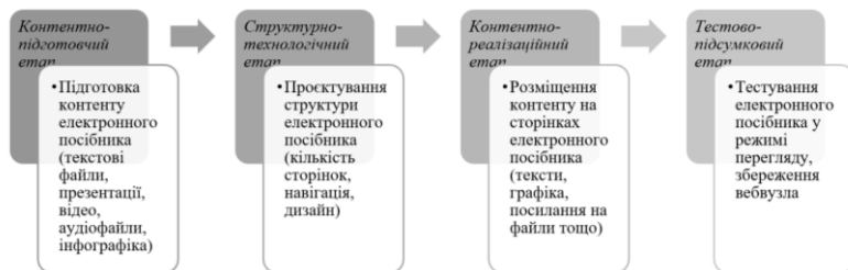
Рис. 1. Етапи технології створення ЦОР

При розробці посібника використано метод корпоративного вебвузла, запропонований Н. Кононец (2016) та відбитий у детальних методичних рекомендаціях (Кононец, 2016). На основі цього методу пропонуємо технологію створення ЦОР у системі підготовки майбутніх учителів математики, яка складається з таких етапів: контентно-підготовчий, структурно-технологічний, контентно-реалізаційний, тестово-підсумковий (рис. 1).