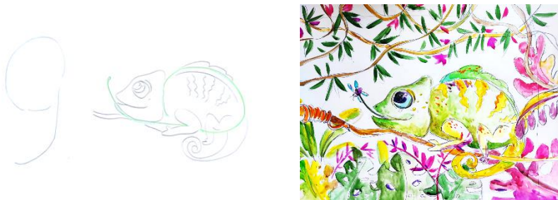
Рис. 1. Перетворення цифри «9» на маленького хамелеона

Мета вправи – звернути увагу на розвиток критичного, креативного та логічного мислення молодших школярів. За допомогою логічного та критичного мислення можна цифри або символи перетворити на будь-який предмет побуту, живу та неживу істоту. Ці прості малюнки, що ґрунтуються на цифрах чи літерах, є помічником у розвитку творчого потенціалу дітей та дорослих.