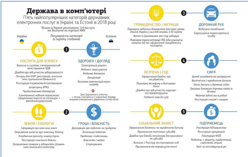
Рис. 2 Найпопулярніші категорії державних електронних послуг (на прикладі Естонії та України, 2018 рік)

Естонія, яка першою у світі збудувала цифрову державу, відчуває гострий дефіцит кваліфікованих кадрів через масову міграцію співгромадян до успішніших країн Європи. Тепер її головне завдання – підвищити рівень життя до західноєвропейських стандартів. Справді, Естонія першою у світі ввела систему інтернет-голосування на виборах і запропонувала іноземцям електронне громадянство. Сьогодні практично будь-яку державну послугу естонці можуть отримати онлайн (рис. 2). А комфортні умови для розвитку технологічних стартапів зробили невелику 1,3-мільйонну країну батьківщиною таких всесвітньо відомих брендів, як месенджер Skype, служба таксі Taxify і перший запущений у масове використання сервіс доставки роботами-кур'єрами Starship Technologies.