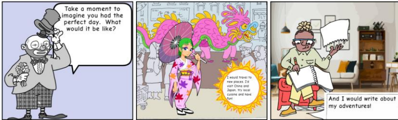
Рис. 3. СЕН-комікс, створений в MakeBeliefsComix

Відмінністю платформи MakeBeliefsComix є те, що вона допомагає створити саме СЕН-комікс, оскільки має вже готові шаблони, які можна заповнювати онлайн або роздрукувати, з переліком відповідних тем (емоційний інтелект, емпатія, вдячність, мрії та бажання тощо).