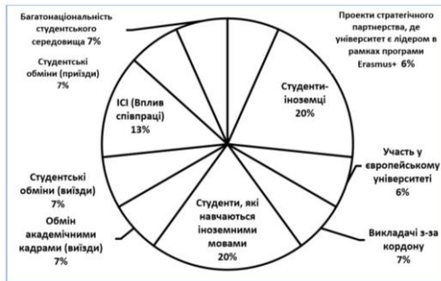
Рис. 2. Структура комплексного показника «Інтернаціоналізація», Perspektywy 2023

Суттєві зміни в структурі комплексного показника «Інтернаціоналізація» відбулися в рейтингу Perspektywy 2023. Змінився не тільки перелік факторів, які враховувалися при визначенні комплексного показника «Інтернаціоналізація», але й питома вага факторів.