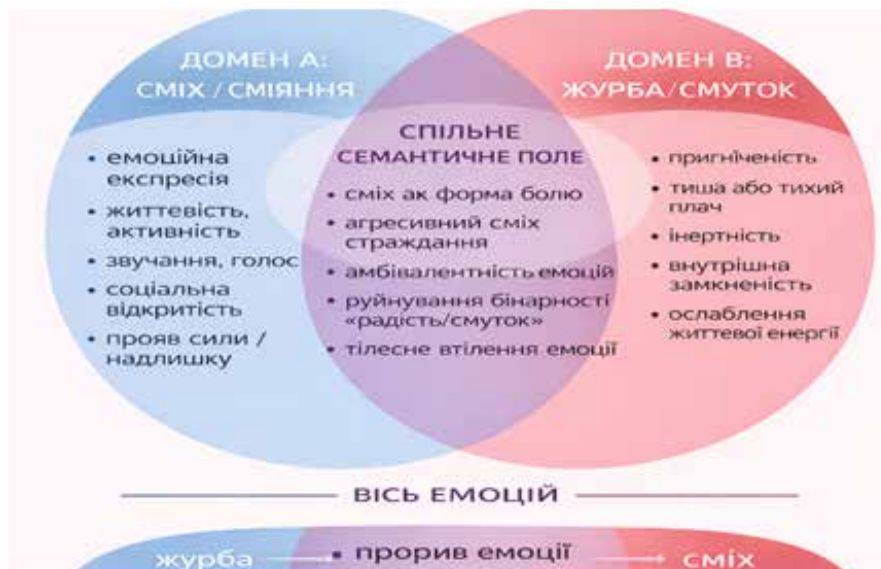
Рис. 2. Механізм утворення парадоксальної метафори Сміялася журба жовтозуба

Отже, антонімія – це відношення між словами, імпліцитний контраст – між фреймами й сценаріями. У поетичній метафорі війни й кризи найчастіше йдеться саме про другий тип: протиставлення не називається, а вводиться як когнітивний процес реконструкції прихованих полюсів.