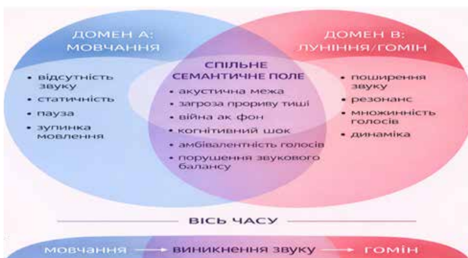
Рис. 1. Механізм утворення парадоксальної метафори Мовчання лунішало в гомін

У парадоксальній метафорі механізм інший: ключовим джерелом смислотворення є не подібність, а несумісність. Саме ступінь конфліктності атрибутів визначає парадоксальність і когнітивну силу образу. Так, у фрагменті Це я знов була хвора: я чула, як сливи росли, / Як хтось кликав мене, і мовчання лункішало в гомін (О. Забужко) зіставлено два протилежні фрейми – акустична відсутність і акустична реалізація. Тут атрибути не просто різні, а принципово несумісні в реальному світі: мовчання не може лункішати. Ця неможливість стає джерелом нового сенсу. Парадокс провокує читача реконструювати прихований механізм: що посилюється? що насправді звучить? де межа між тишею й голо- сом? Домени мовчання й лунішання конфліктують: мовчання не має звучання, лунішання передбачає зростання інтенсивності звуку. Парадокс тут не зводиться до оксиморонного